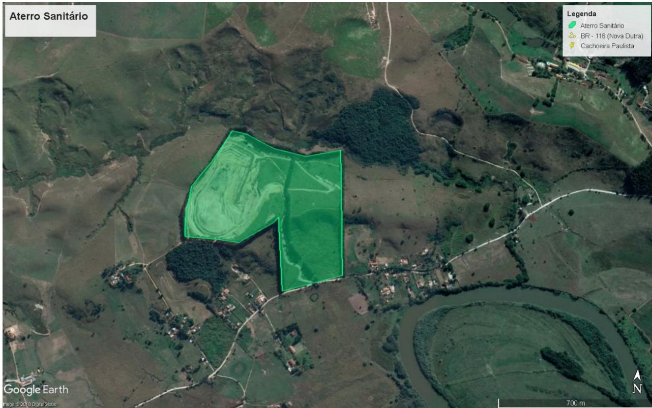
Figura 4: Aterro Cachoeira Paulista