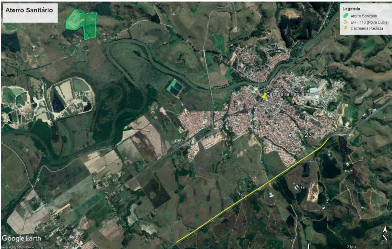
Figura 3: Aterro Cachoeira Paulista