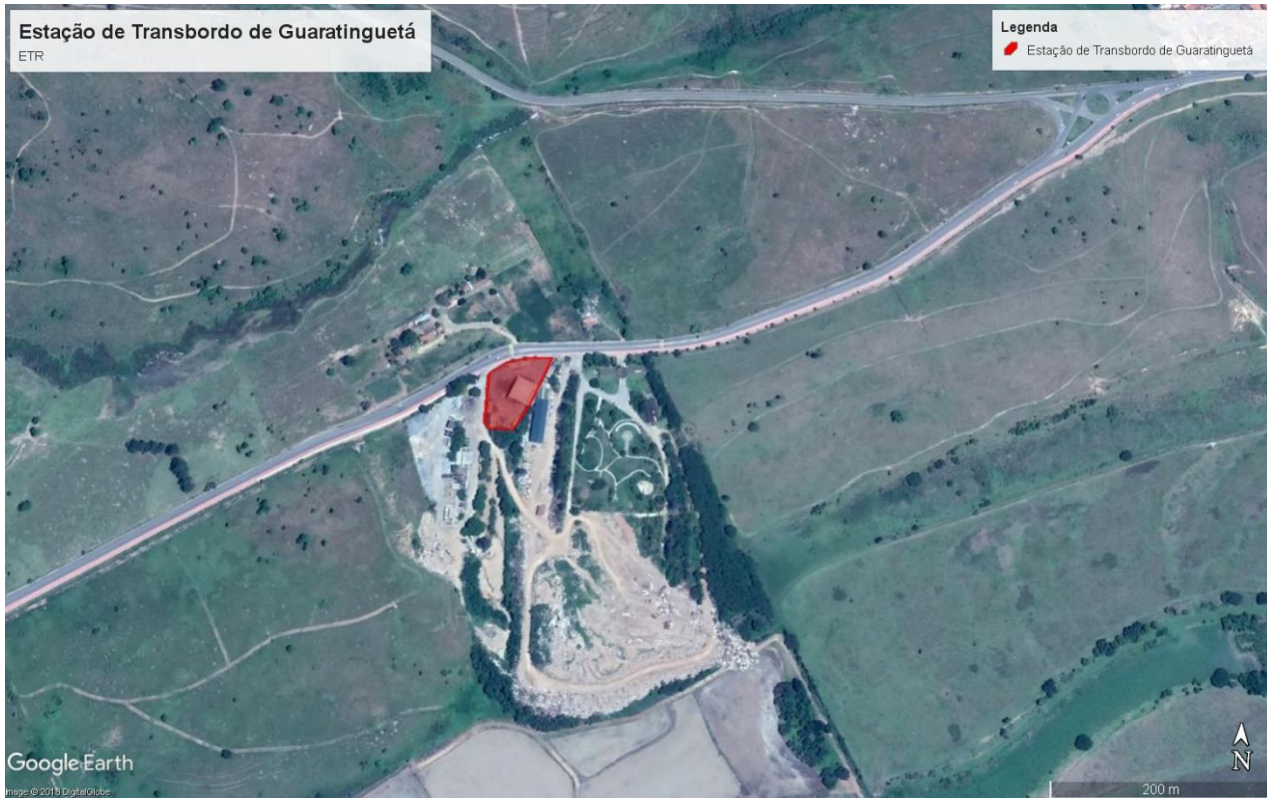
Figura 2: ETR Guaratinguetá