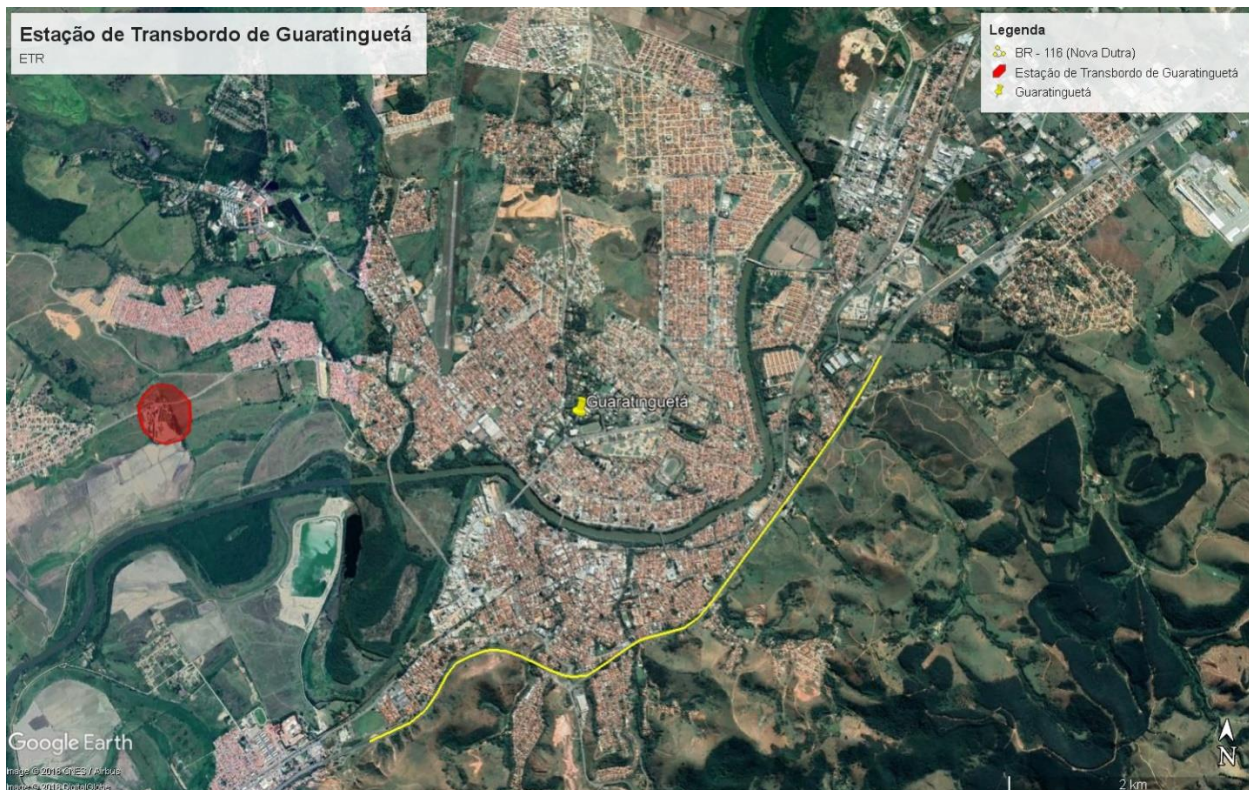
Figura 1: ETR Guaratinguetá

A Figura 5 mostra a distância entre os dois locais, indicada pelo Google Maps como a rota mais rápida, o qual este termo de referência leva em consideração para estimativa dos custos. A distância da ETR em Guaratinguetá até o Aterro Sanitário de Cachoeira Paulista é de aproximadamente 40 km (Figura 5). Na figura 6 é apresentado o trajeto entre o Aterro Sanitário e ETR, considerado o trajeto de volta, que foi de aproximadamente 36 km. Neste trecho indicado, não há pedágio nas rodovias que podem ser utilizadas.